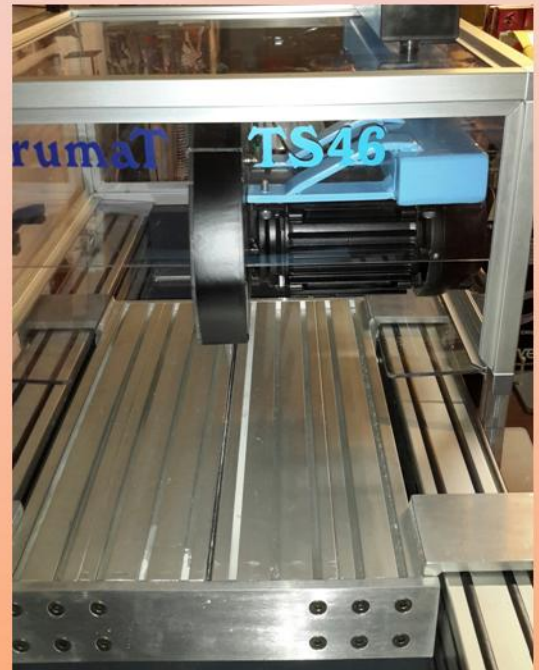
Tavola scanalata in alluminio , scorrimento preciso e leggero su guide in acciaio inox . La tavola è supportata da quattro carrelli a tre cuscinetti cadauno con precarico registrabile ,sempre in acciaio inox

a copertura lama con lubrificazione integrata