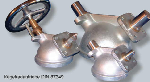
Kegelantriebe DIN 87349