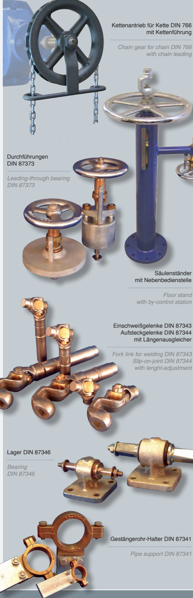
Kettenantrieb für Kette DIN 766 mit Kettenführung