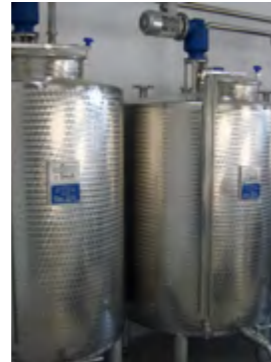
MISCELATORI ATEX PER BAGNA ALCOLICA