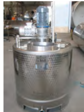
MIXER CON DUE AGITATORI PER CREME