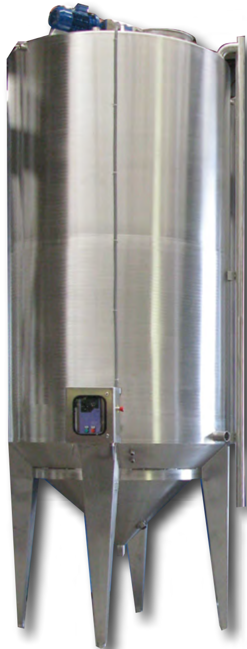
MIXER CONCENTRATO POMODORO