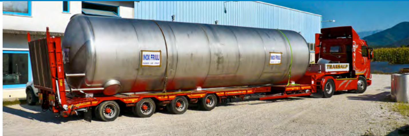
SERBATOIO PER USO CIVILE