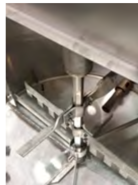
PARTICOLARE MIXER INTERNO