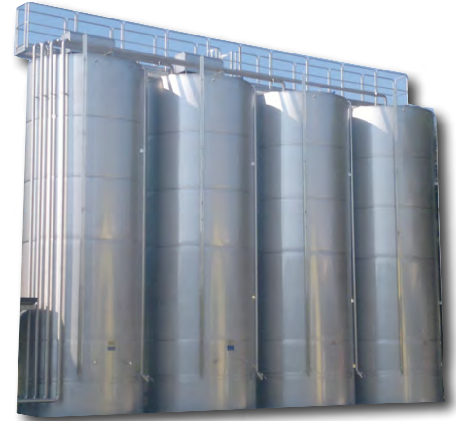
SERBATOI CON AGITATORE PER STOCCAGGIO DILUENTE