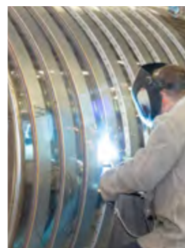
MIXER INDUSTRIA ALIMENTARE