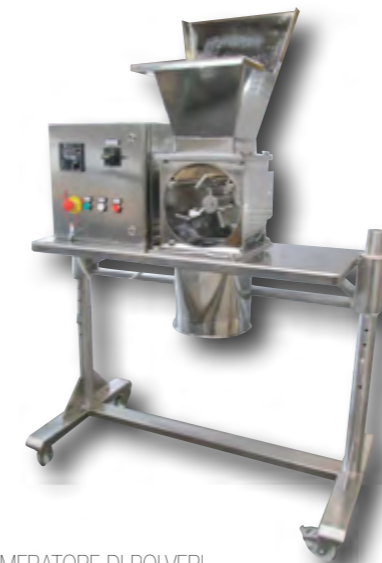
DISSAGLOMERATORE DI POLVERI