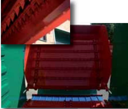
El dosificador actúa como alimentador del forraje sobre la plataforma de descarga consiguiendo que la distribución de la descarga lateral sea continua y uniforme. Las cadenas del dosificador incorporan travesaños con púas raspadoras que arrancan el forraje del interior del remolque, elevándolo hacia la parte superior por el sentido de giro de las cadenas y cayendo por peso por la parte posterior sobre la plataforma de descarga o al suelo.