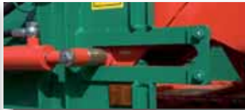
El dosificador de descarga incorpora un sistema de desplazamiento hacia la parte trasera que se acciona durante el proceso de descarga aligerando la presión que el forraje durante el proceso de carga ejerce sobre el mismo y evitando posibles atascos en el momento de arranque de la rotación de las cadenas de distribución del dosificador.