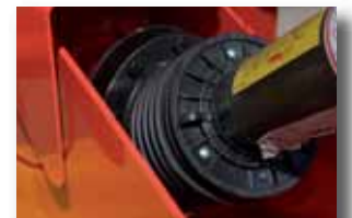
La segunda con nudo estándar y nudo homocinético.