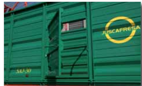
Puerta lateral de acceso al interior de la máquina.