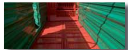
Cadenas del piso para la descarga del forraje con regulación de velocidad de avance.