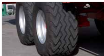
Eje balancín que incorpora un sistema de elevación del eje delantero para terrenos de alto desnivel al aumentar el peso sobre el enganche y así el tractor obtener una mayor tracción, también es muy apropiado en caso de requerir aumentar un poco la altura en el proceso de la descarga. Ruedas 560/45-22,5" de flotación radial.