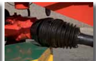
2 transmisiones, la primera con nudo homocinético y embrague de discos a fricción