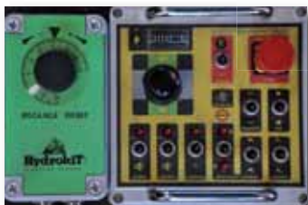
Botonera de mandos con conexión vía cable para el accionamiento de todas las funciones con regulador eléctrico del avance de las cadenas.