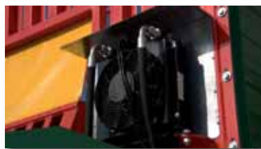
Circuito hidráulico con refrigeración.