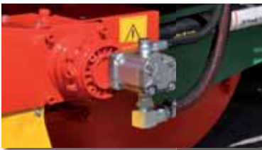
Bomba hidráulica independiente que acciona la noria alimentadora y el dosificador.