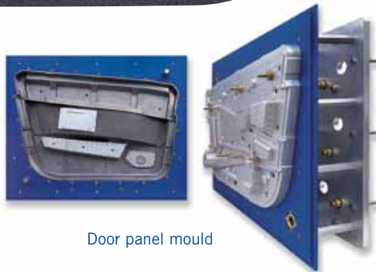
Door panel mould

Partikelschaumwerkzeuge Particle foam moulds PUR Schaumwerkzeuge PUR foam moulds RF Partikelschaumwerkzeuge RF Particle foam moulds