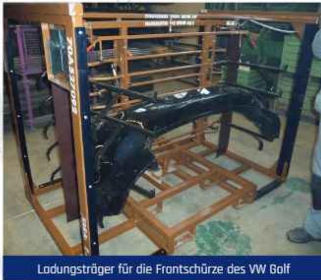
Ladungsträger für die Frontschürze des VW Golf