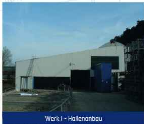
Werk I - Hallenanbau

Das besonnene Vorgehen zahlt sich aus. Denn ebenso schnell, wie die Aufträge wegfallen, kommen sie Ende 2009 wieder zurück. Zum 50-jährigen Jubiläum 2013 kann das Unternehmen die Produktion auf 1.000 Gitterboxen pro Tag steigern und etabliert sich als bedeutende Branchengröße in Deutschland. Auch die Modernisierung kann dank neuer Maschinen und einer eigenen Pulverbeschichtungsanlage fortgeführt werden.