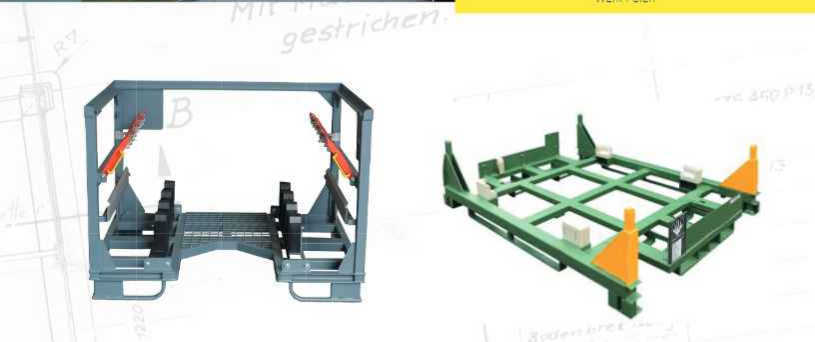
Sonderladungsträger für Automotive