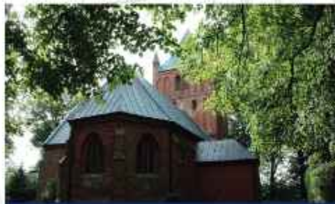
Die Dorfkirche in Bast