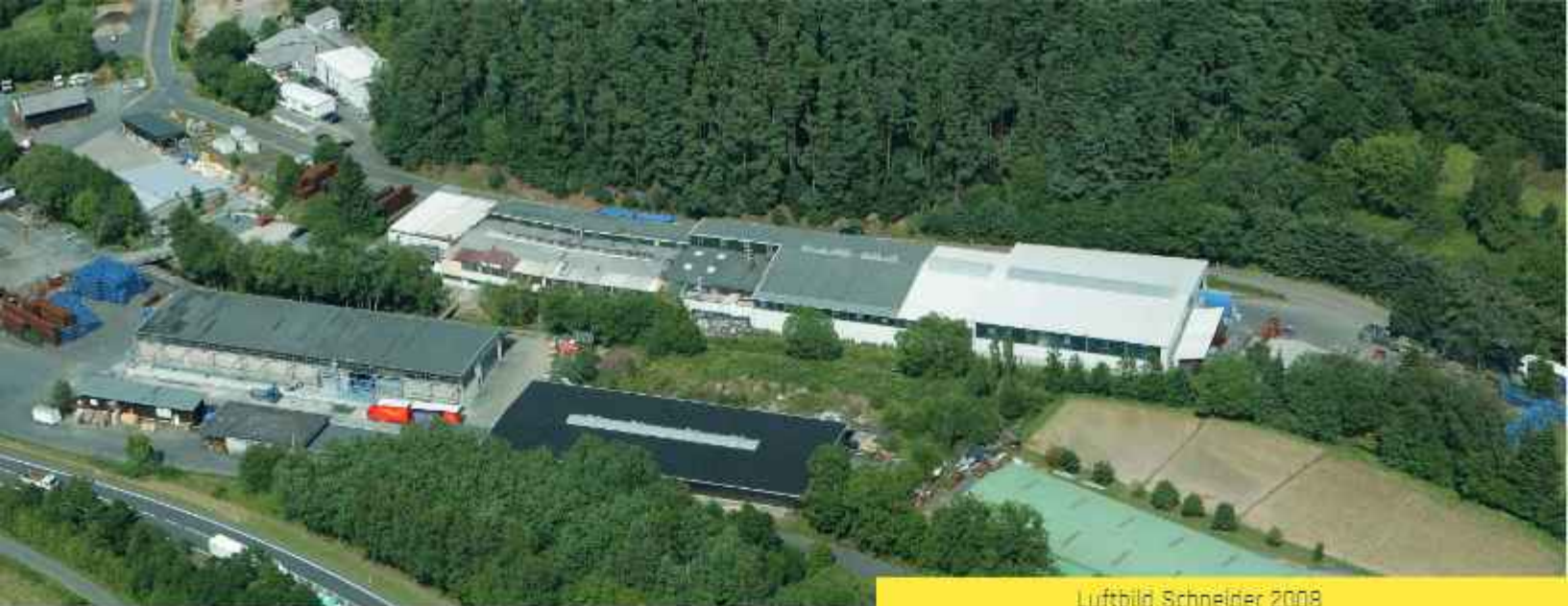
Luftbild Schneider 2008