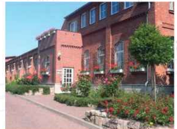
Das Weimarer Zweigwerk