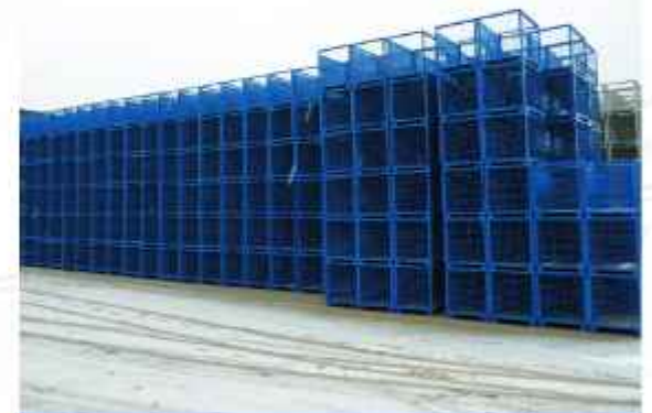
Schneider-Gitterboxen in den 1990er Jahren

Da das Gebäude über eine eigene Lackieranlage und einen Verwaltungstrakt verfügt, scheint die Investition in ein Zweigwerk überaus erfolgversprechend. Die Halle in Weimar ist jedoch in einem weitaus schlechteren Zustand als erwartet und der erhoffte neue Absatzmarkt in Ostdeutschland erweist sich als Fehleinschätzung.