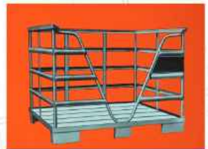
BOX-Palette nach DIN 15142; 1970er