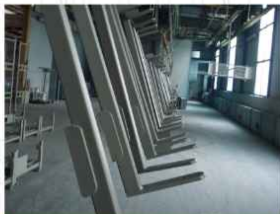
2008 herrscht auch in der Tracknungsanlage Stillstand