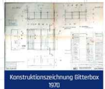
Konstruktionszeichnung Gitterbox 1970