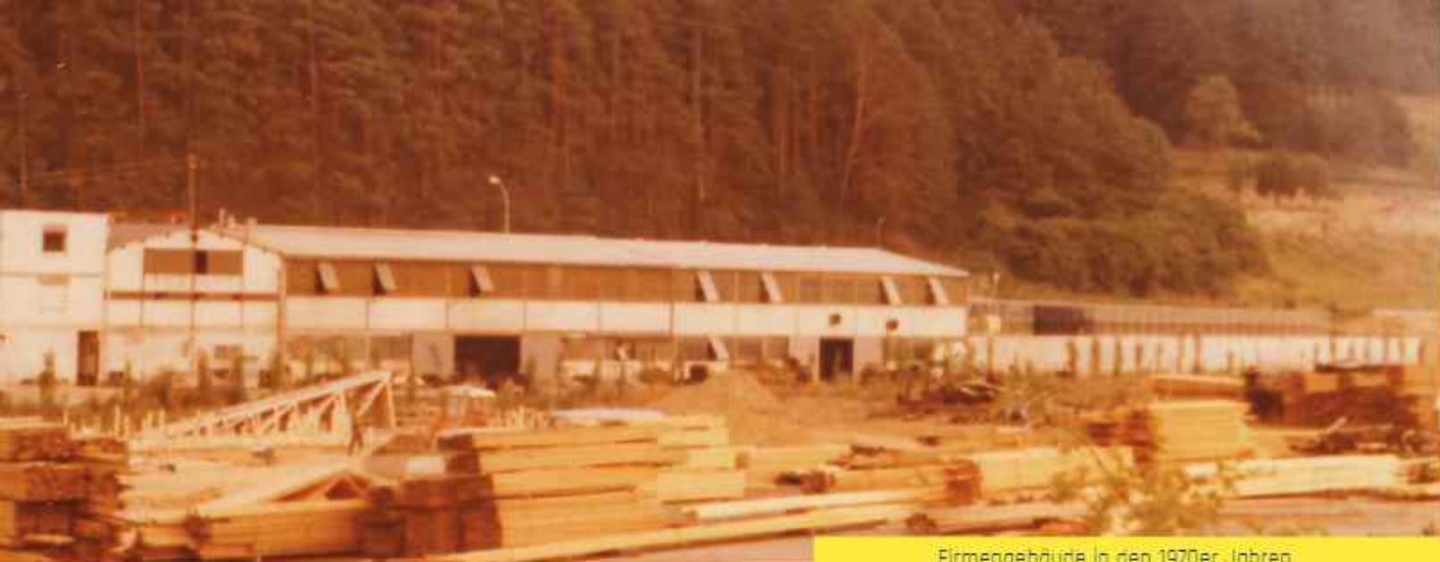
Firmengebäude in den 1970er Jahren