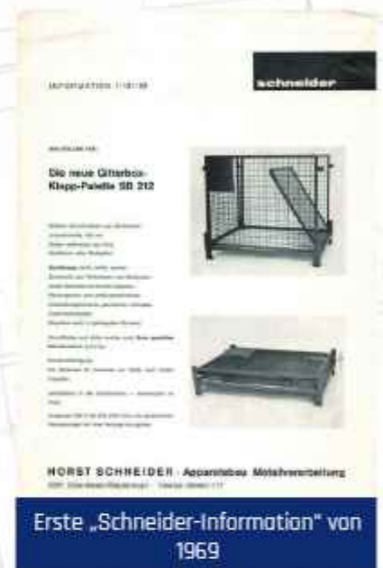
Erste „Schneider-Information“ von 1969

Dank dieser Projekte gelingt der Einstieg in die Gitterboxproduktion. Zunächst fungiert Schneider zwar ausschließlich als Subunternehmer seiner Kunden, doch noch im selben Jahr werden eigene Entwicklungen, wie die Schneider-Klapp-Gitterbox präsentiert.