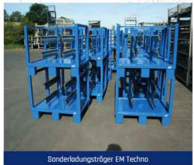
Sonderladungsträger EM Techno