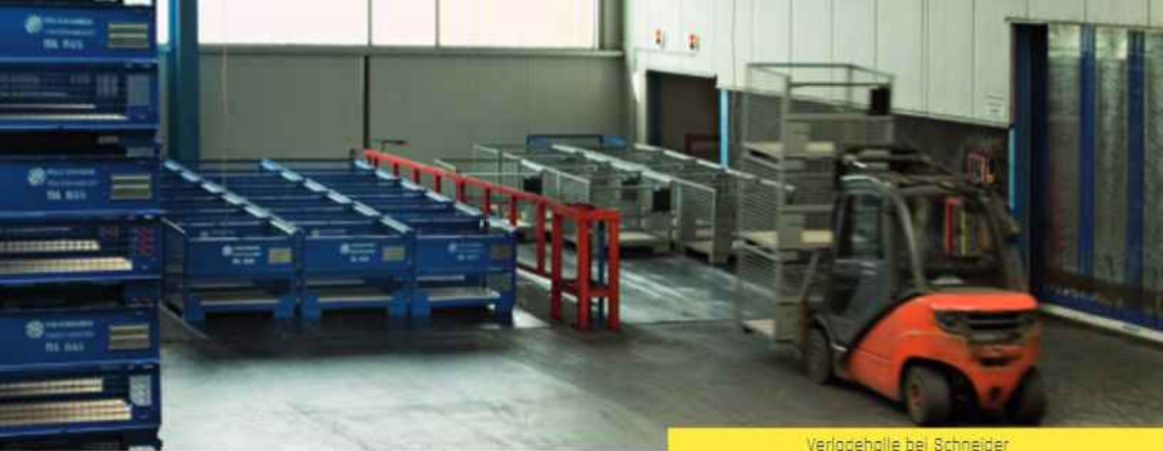
Verladehalle bei Schneider