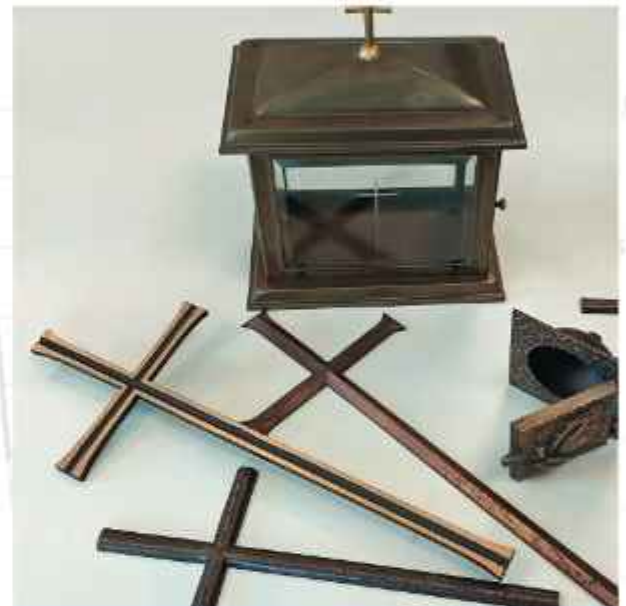
Die ersten Produkte 1963

Bereits nach wenigen Jahren platzt die Werkstatt aus allen Nähten. 1965 kauft das Ehepaar Schneider deswegen ein Grundstück außerhalb des Dorfes und lässt dort 1967 eine moderne Werkhalle errichten. Hier befindet sich die Firma Schneider bis heute.