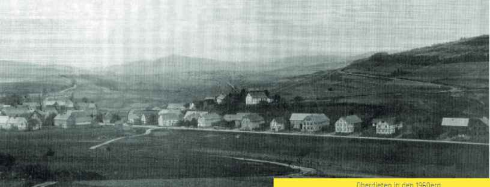
Oberdieten in den 1960ern