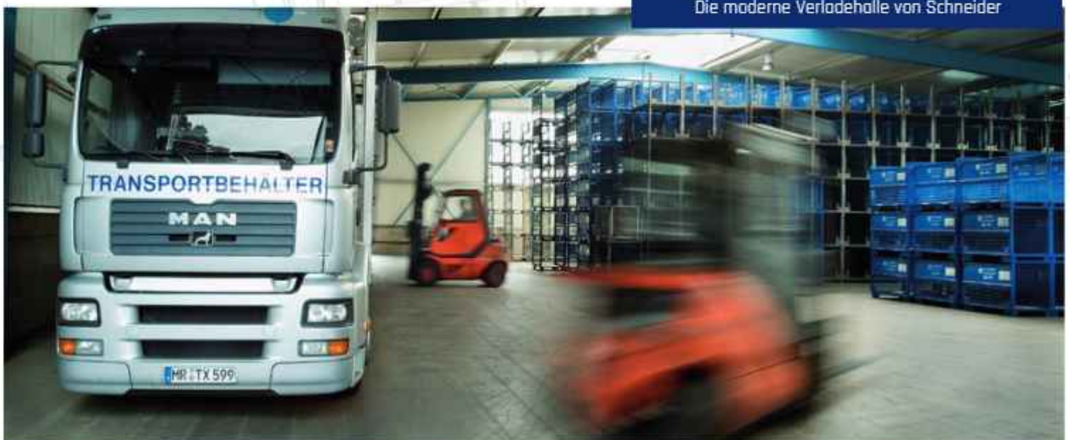
Die moderne Verladehalle von Schneider