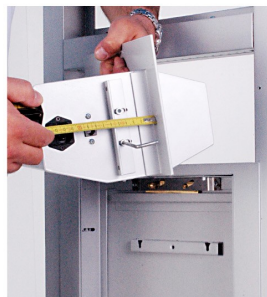
12. REGOLARE I DISTANZIALI DEL PASSARICETTE UN MILLIMETRO MENO DELLO SPESSORE TOTALE DEL TELAIO DEL VS. INFISSO