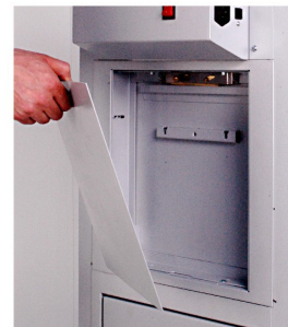
10. INSERIRE IL PANNELLO DI CHIUSURA INTERNO NELL'APPOSITA FERITOIA INFERIORE