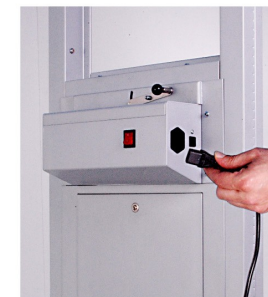
16. INSERIRE IL CAVO DI ALIMENTAZIONE 220 V E LA SPINA PLUG PER IL CORDLESS