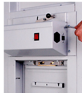
15. AVVITARE LA GHIGLIOTTINA AL PASSARICETTE CON VITI IN DOTAZIONE