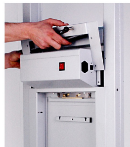
14. DALL'INTERNO: POSIZIONARE LA GHIGLIOTTINA SUPERIORE