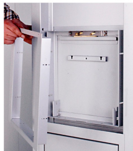
8. DALL'INTERNO: INSERIRE IL TELAIO (2) DELLA TRAMOGGIA