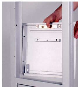
7. DALL'ESTERNO: INSERIRE IL TELAIO (1) DELLA TRAMOGGIA