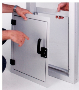
3. DALL'INTERNO: INSERIRE LO SPORTELLO NEL TELAIO (1) FINO A FARLI ADERIRE PERFETTAMENTO AL TELAIO DELL'INFISSO