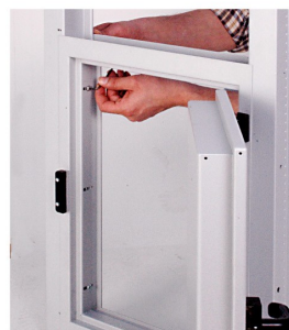
4. APRIRE L'ANTA, STRINGERE I DUE TELAI E FISSARLI CON LE APPOSITE VITI IN DOTAZIONE