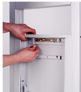
9. STRINGERE I DUE TELAI E FISSARLI CON LE APPOSITE VITI IN DOTAZIONE