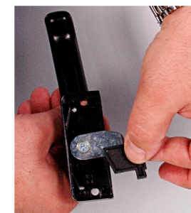
6. SPOSTARE FERMO BAIONETTA SUL LATO DESIDERATO