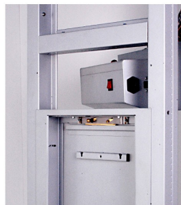
13. INSERIRE DALL'ESTERNO IL PASSARICETTE