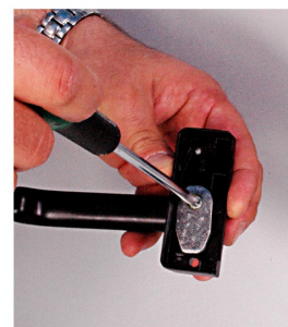
5. PER INVERTIRE APERTURA SPORTELLO (DX/SX) SVITARE BAIONETTA MANIGLIA E RUOTARE DI 90°