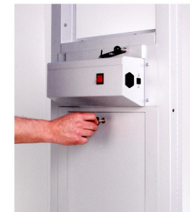
11. CHIUDERE CON LA CHIAVE LA SERRATURA DEL PANNELLO